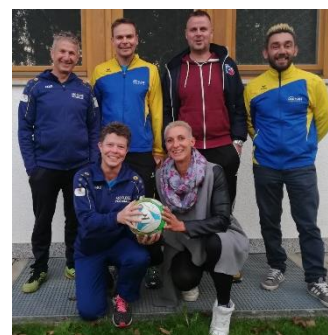
Das Foto wurde vor Covid-19 aufgenommen