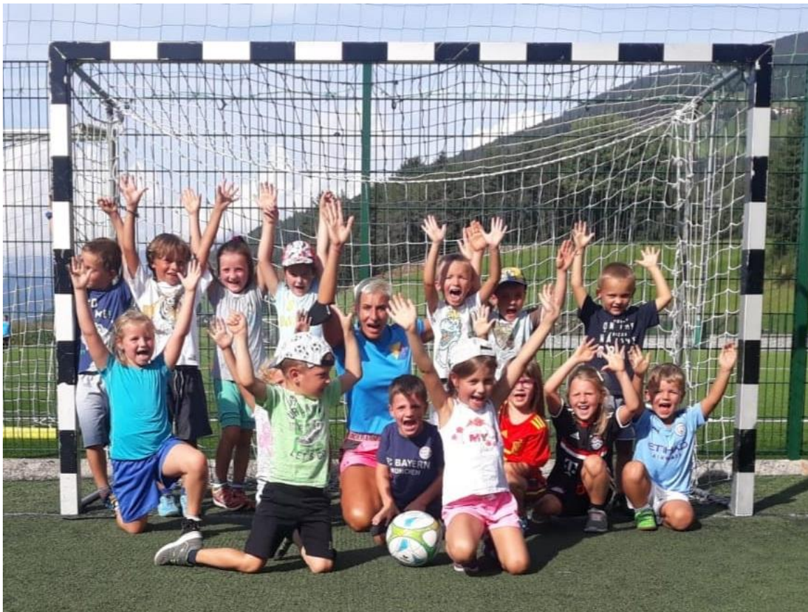
Das Foto wurde vor Covid-19 aufgenommen

Für Neuanmeldungen bitte die Nummer 331-4491157 (Barbara) kontaktieren