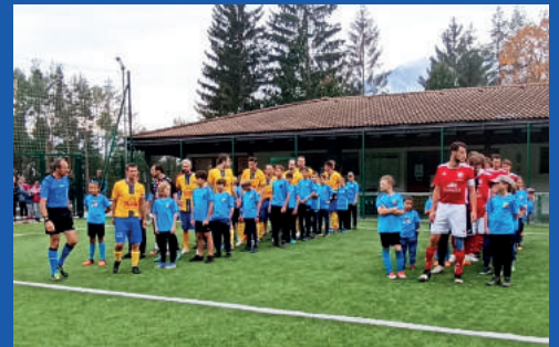
Jugend beim Einlaufen gegen Mareo