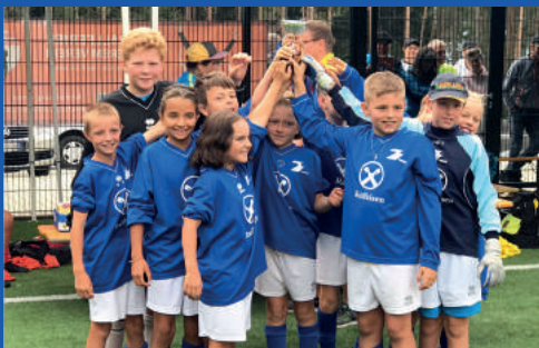
Jugendturnier St. Andrä