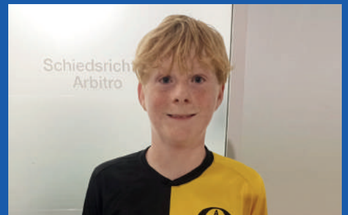
Profanter Moritz B-Jugend Milland