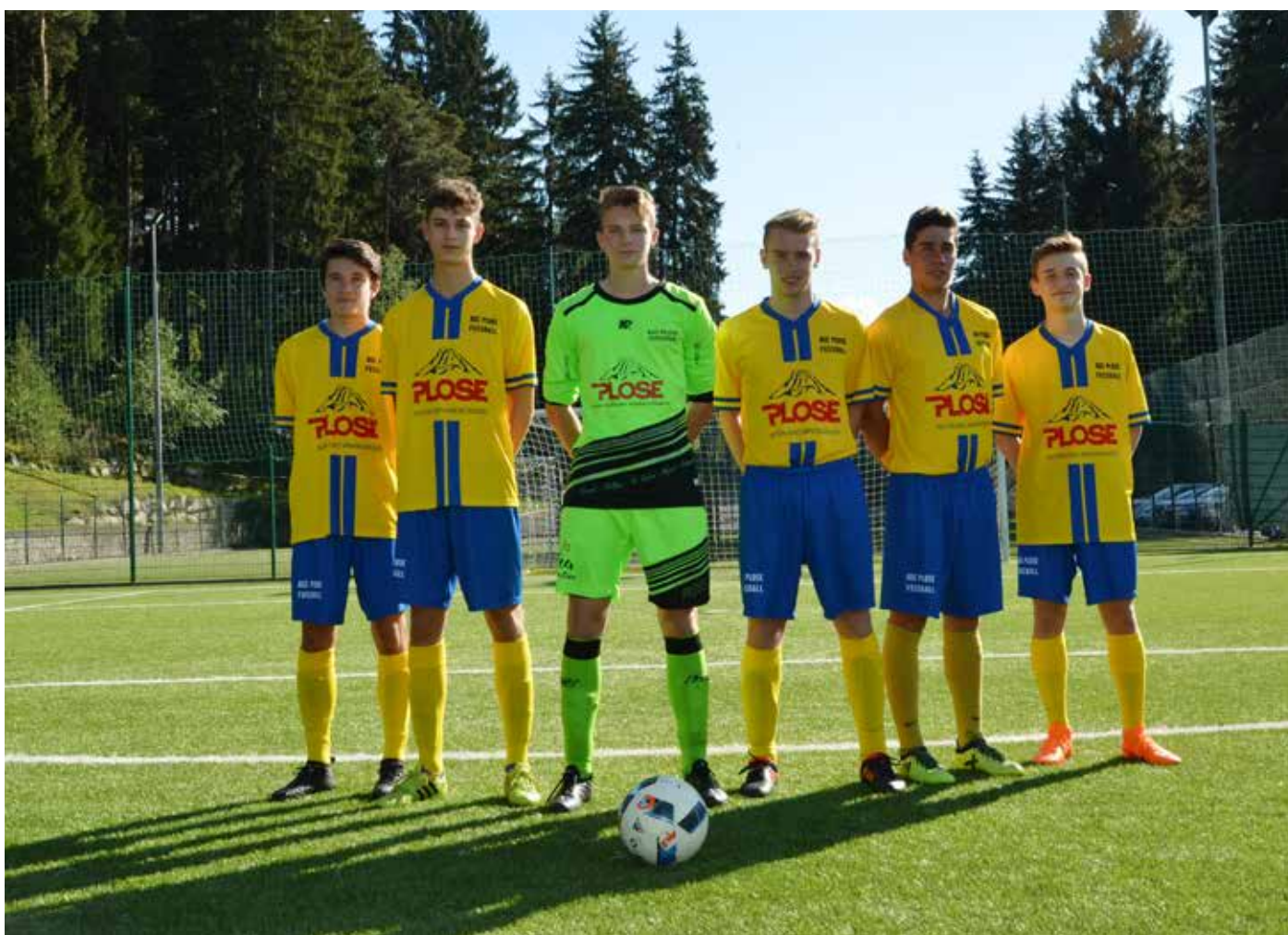
Unsere Abwehr war bisher leider überbeschäftigt...

ernüchternden Ergebnisse ist sicher, dass 5 Spieler der Junioren bei der ersten Mannschaft spielen und die Junioren somit meist nur zu 11t oder zu 12t zu den Spielen kommen. Dazu kommen jetzt auch noch 2 verletzte Spieler. Wie man sieht habens unsere Junioren nicht ganz einfach... Nun hofft man eine gute Vorbereitung für die Rückrunde zu gestalten und im Frühjahr dann zu Punkten und vielleicht auch noch den ein oder anderen Punkt in den verbleibenden 4 Spielen zu holen. (of)