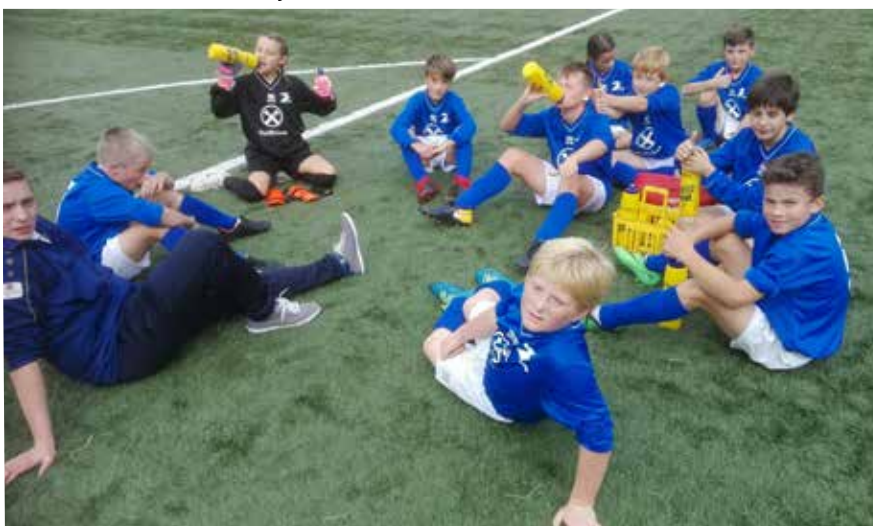
Fix und fertig war die Mannschaft nach den 2-2 gegen SSV Brixen