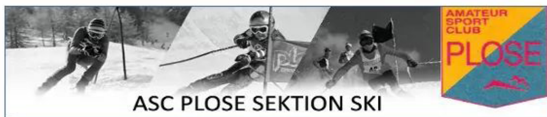
ASC PLOSE SEKTION SKI